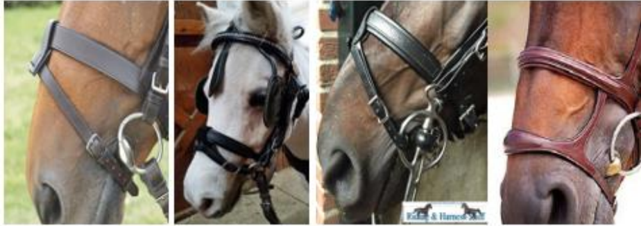
(nachrapnik ze skońnikiem lub z dolnym paskiem)

We wszystkich kategoriach niedozwolone są : kinton, „bit lifters”, (nachrapnik z dolnym paskiem lub skońnikiem).