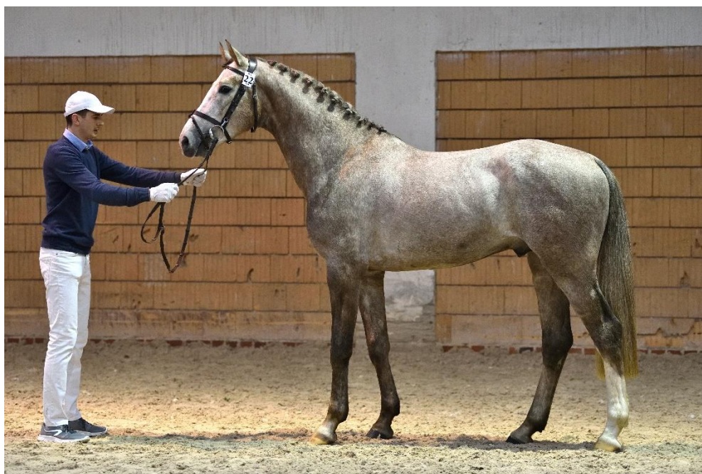
Przykład prawidłowo wypielęgnowanego ogiera Crazy Star-PP sp (Olimpic Star DSP – Ceitara westf. / Castillo hol.), hod. Barbary Prusiewicz i elegancko ubranego prezentera spełniających standardy, zgodnie z obowiązującym regulaminem.