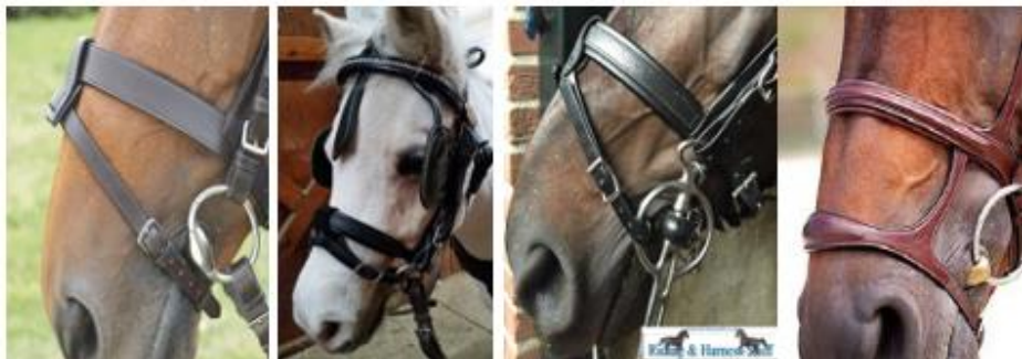
(nachrapnik ze skośnikiem lub z dolnym paskiem)

We wszystkich kategoriach niedozwolone są : kinton, „bit lifters”, (nachrapnik z dolnym paskiem lub skośnikiem).