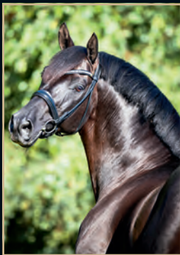
CADEAU NOIR CHRIST - DE NIRO