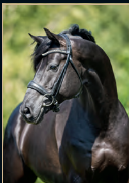
MORRICONE MILLENNIUM - RUBIN ROYAL OLD