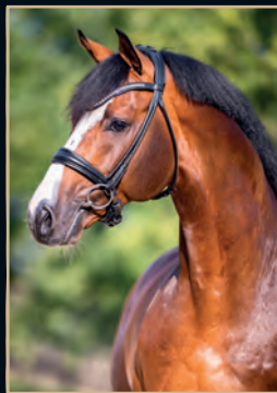
CASHMERE CRISTALLO - CONTENDER