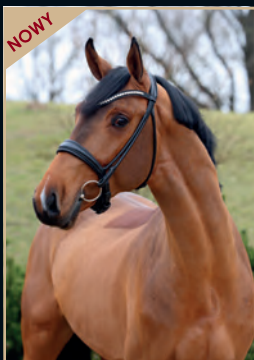
CHACCO VAN'T ROOSAKKER CHACCO-BLUE - ECHO VAN'T SPIEVELD