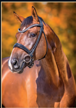
DEMOCRACY D'AVIE - DESPERADOS