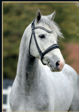
CHEVALIER CHECKTER - CORNET FEVER