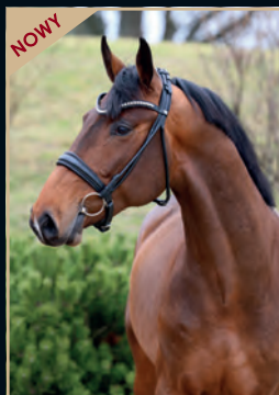
JAMES BROWN JAMES BLUE - LATOUR VDM