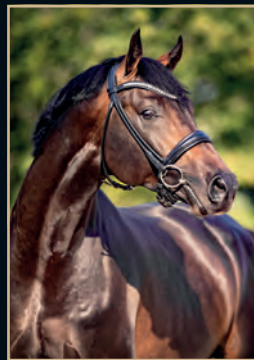
COEUR DE BELLA DONNA CORNET OBOLENSKY - BALDINI II