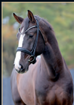
NIKAN'S DIAMOND KANNAN - C-INDOCTRO