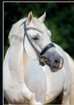
CORDESS CLINTON - HEARTBREAKER