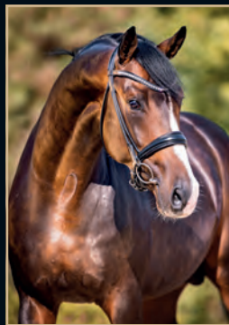
FIANCÉ FOUNDATION - WYNTON