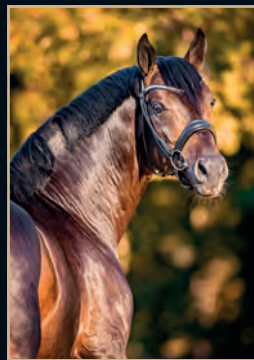
FIDELITY FIDERDANCE - SANDRO HIT