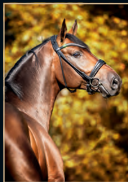
SIXPACK SCHENKENBERG - CALIDO I