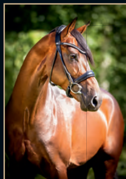
ZINEDREAM ZINEDINE - CONTENDER