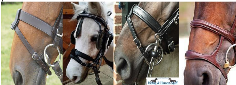
(nachrapnik ze skośnikiem lub z dolnym paskiem)

We wszystkich kategoriach niedozwolone są : kinton, 'bit lifters', (nachrapnik z dolnym paskiem lub skośnikiem).