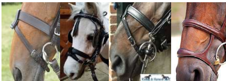
(nachrapnik ze skośnikiem lub z dolnym paskiem)

We wszystkich kategoriach niedozwolone są : kinton, 'bit lifters', (nachrapnik z dolnym paskiem lub skośnikiem).